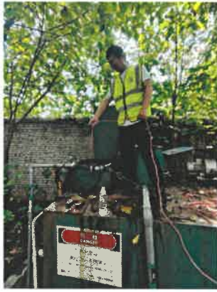
污水处理设施排口